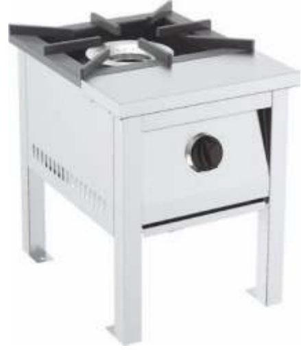
Kusina - GRCY012LPG Kusina - GRCY012NG