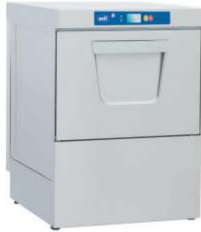
OBY-500 Set Altı Bulaşık Makinesi 1445 EUR