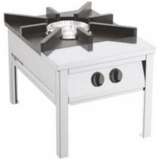
Kusina - GRCY015LPG Kusina - GRCY015NG