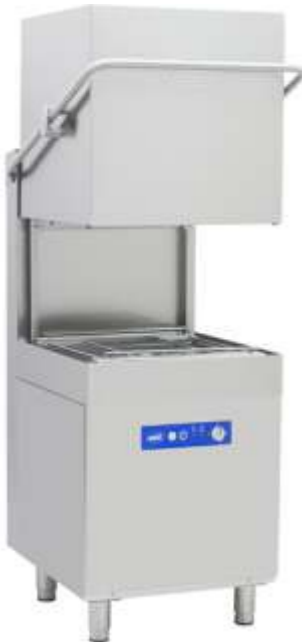
OBY-1000 Giyotin Tip Bulaşık Makinesi 2280 EUR