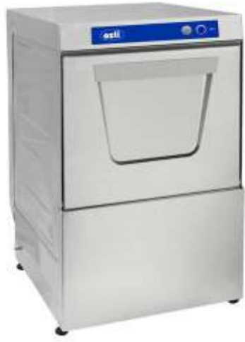
OBY-35M Bardak Yıkama 1200 EUR OBY-40M Bardak Yıkama 1300 EUR