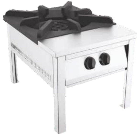
Kusina - GRCY024LPG Kusina - GRCY024NG