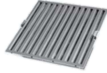
DVF-01 Davlumbaz Filtresi Tamamı 430 Kalite Paslanmaz Çelik Boyutlar 50x50 20 EUR