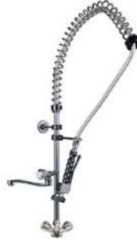
T-02 190 EUR Tezgaha Monte Ara Musluklu