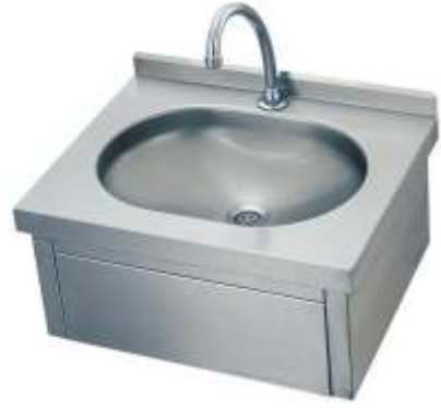
DBE-01 Senox Dizden Basmalı Evye Tek Su Giriş 495 x 445 x 265 mm 304 CRN Tek Su Girişli 250 EUR