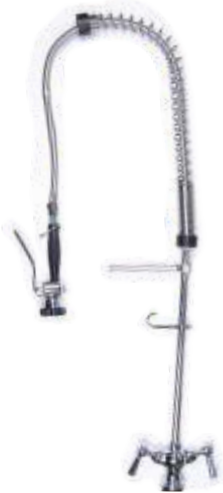
TM-01 175 EUR Tezgaha Monte Ara Musluksuz